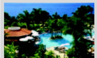
L'hôtel Vila Porto Mare.