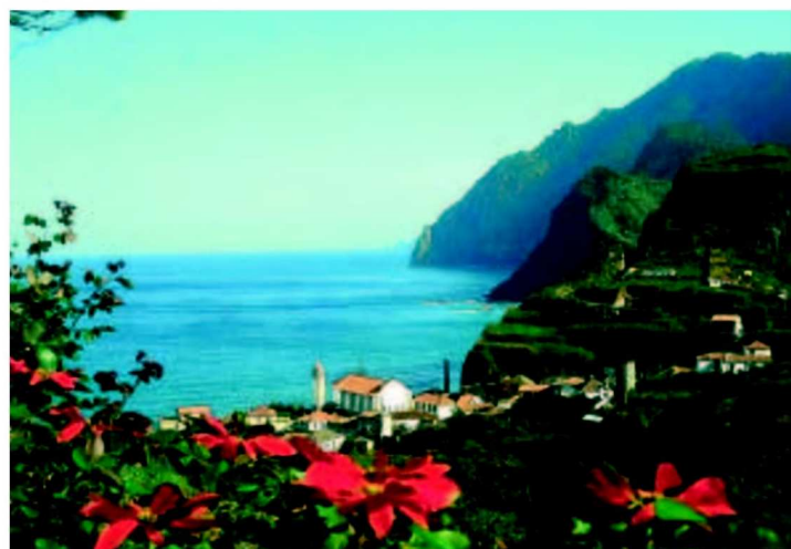
L'île de Madère dans toute sa splendeur.

dère. Les vignes sont nombreuses sur l'île et les paysans adoptent encore les méthodes ancestrales en écrasant le raisin avec les pieds. En allant sur l'archi-